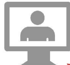
ورود به پنل آزمون

پس از وارد کردن نام کاربری و رمز عبور خود در کادر زیر و کلیک بر روی دکمه ورود، وارد محیط آزمون اینترنتی می شوید.