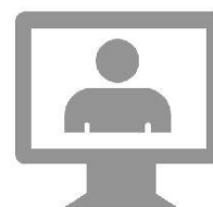
ورود به بنل آزمون